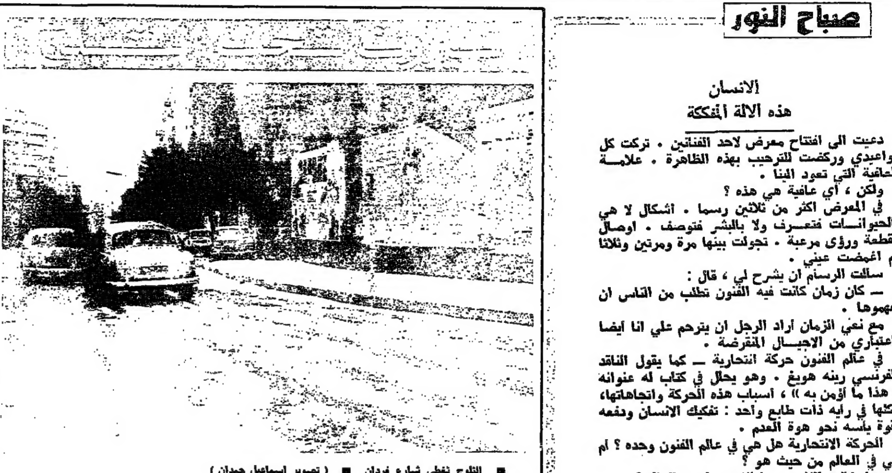
التلويح لثقي شارع فردان